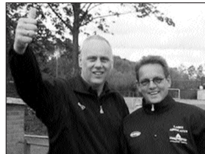
De technische leiding tijdens de kampioenswedstrijd van B3